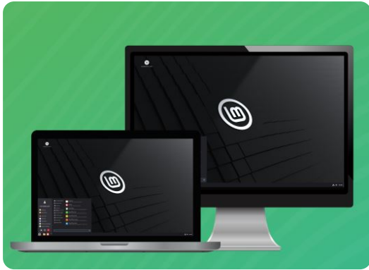
Bild: Screenshot linuxmint.com